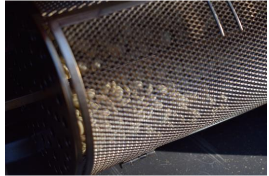
Der Beginn der Röstung