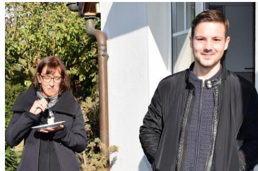
Ein Teil des Teams