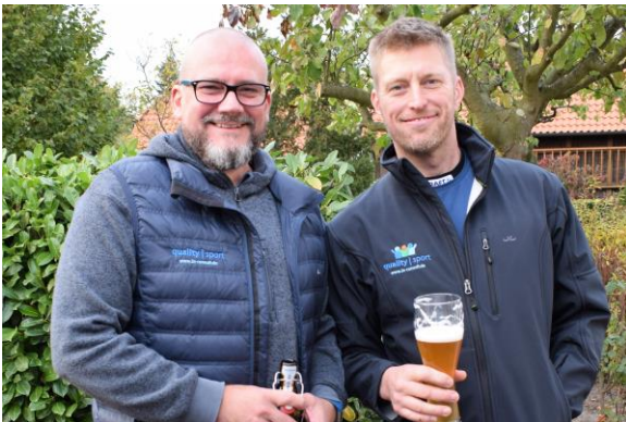
Ein Teil des Teams